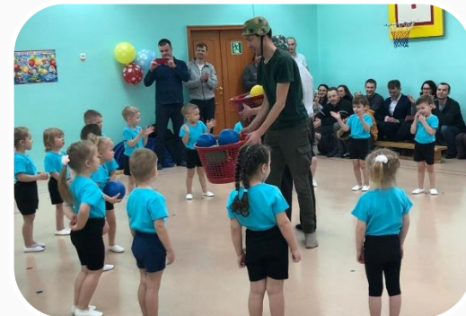
Взаимодействие с родителями