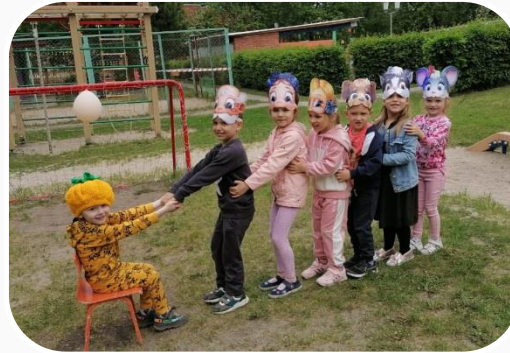
Различные виды детской деятельности

Условия реализации Программы должны обеспечивать полноценное развитие личности во всех основных образовательных областях, через: