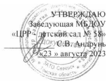
Примерная сетка непосредственно образовательной деятельности средней группы № 8